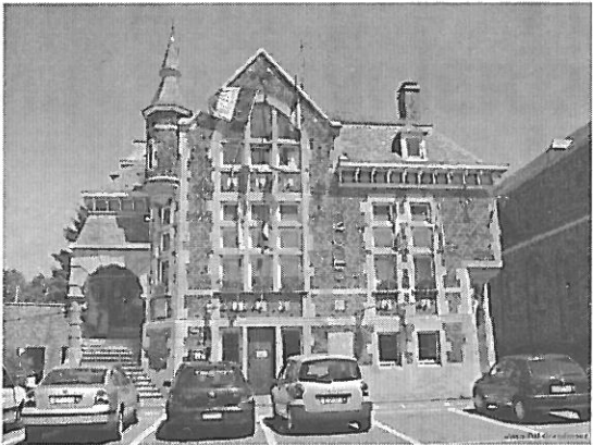
La Maison Communale (Battice)